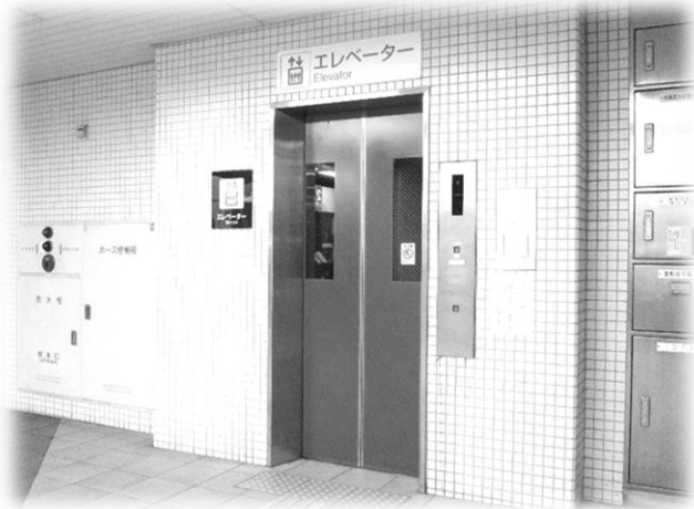
かいさつ はい ひだり ↑改札を入ってすぐ左にあります。