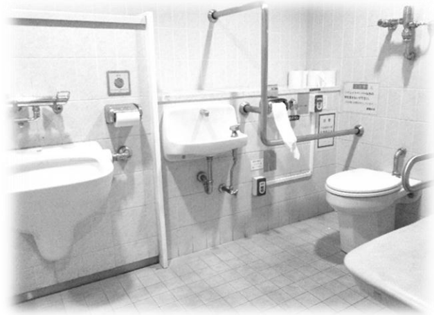
たもくてき しんしょうしゃ ↑多目的トイレ(身障者トイレ)は、