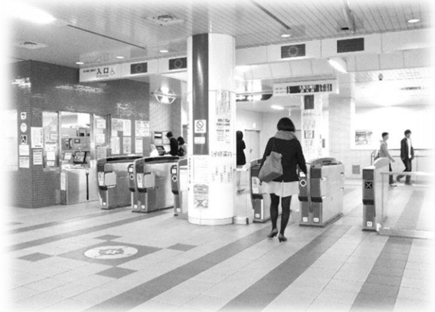
くるまい す とお かいさつ えきいん ↑車椅子が通れる改札は、駅員がいるところ のみです。

くるまいすりようしゃ しょうめん はい が、車椅子利用者は正面からは入りにくい。