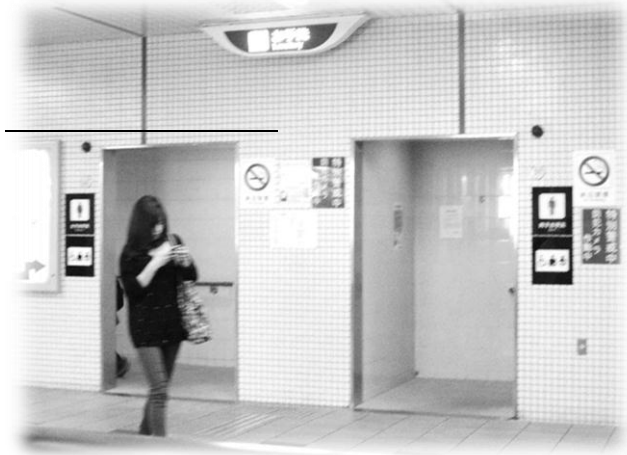
かいさつまえ ↑トイレは改札前にあります。