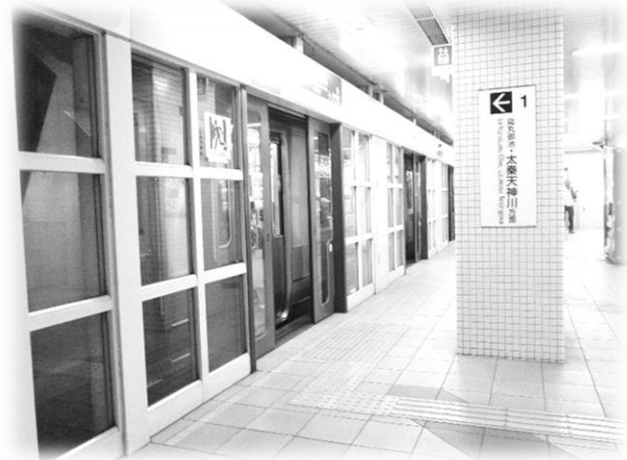
かんぜんせっち あんしん あんしん ↑ホームドア完全設置で、安心、安心。