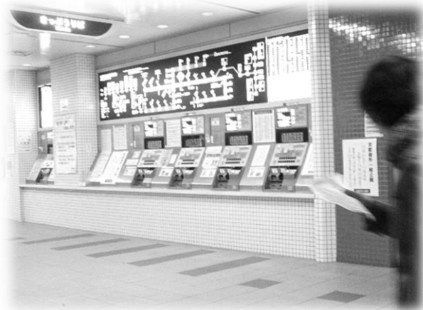
けんばいき じゃつかん ひく せっち ↑券売機は、若干低く設置されています

くるまいすりようしゃ しょうめん はい が、車椅子利用者は正面からは入りにくい。